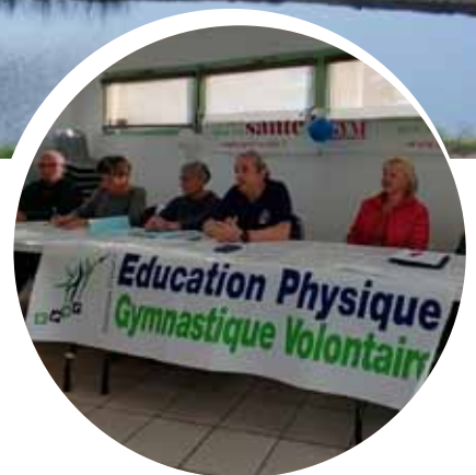
p. 11 - EPGV, label qualité club