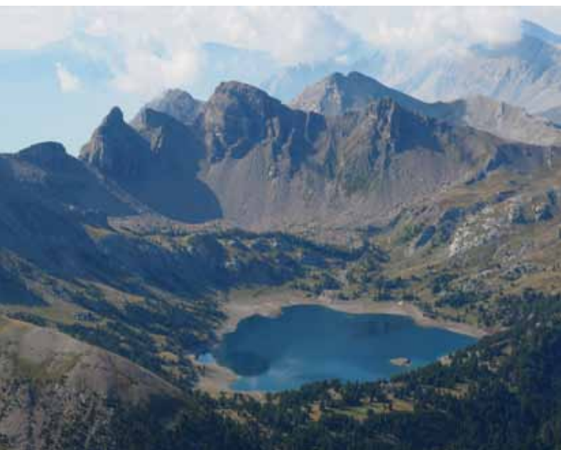
Sortie au Lac d'Allos dans le Mercantour – Août 2022

Avis aux amateurs et... à bientôt sur les sentiers !