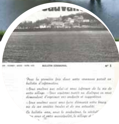
p. 7 - 1972 - 50 ans...