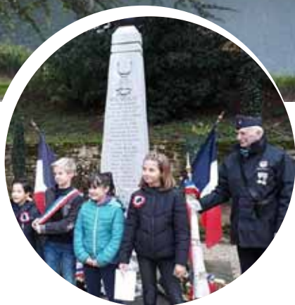
p. 4 - Rétro en images