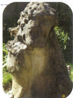
Ce qu'il reste des fiers lions qui ornaient les bassins du parc

Depuis 2003, le fossé, le long de la montée du St Fély, est raccordé aux bassins pour éviter le déversement du fossé dans le bois et les lotissements.