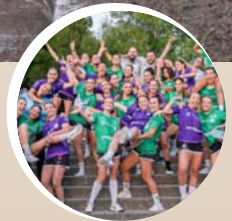
p. 12 - US Véore