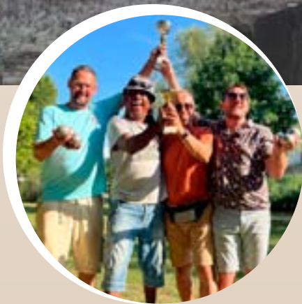
p. 5 - Repas républicain